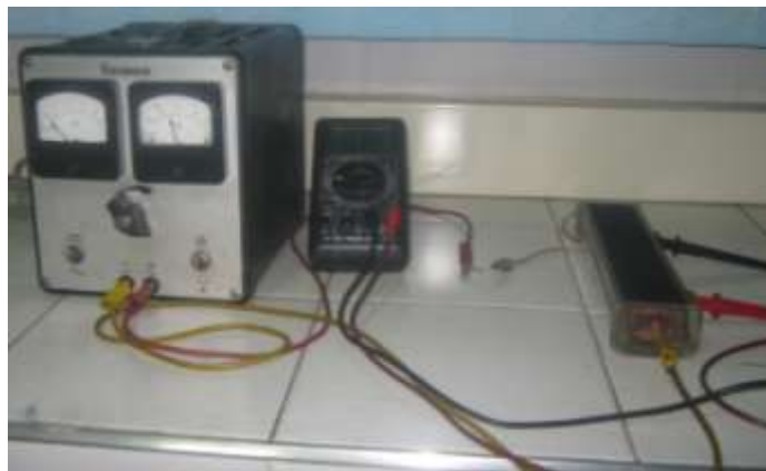
Figura 1. Montaje experimental.

Se utilizaron equipos como una fuente de corriente directa variable entre 0-30 v, una caja de Müller, dos multímetros, una resistencia de prueba de 1M\Omega , una balanza, agua destilada y cables o conectores. La recolección de los datos se realizó de acuerdo a la siguiente figura: